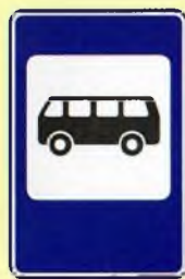
Место остановки автобуса и (или) троллейбуса

ПРАВИЛА ДОРОЖНОГО ДВИЖЕНИЯ ОДИНАКОВЫ ДЛЯ ВСЕХ – ВЗРОСЛЫХ И ДЕТЕЙ!