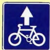
Полоса для велосипедистов