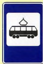
Место остановки трамвая